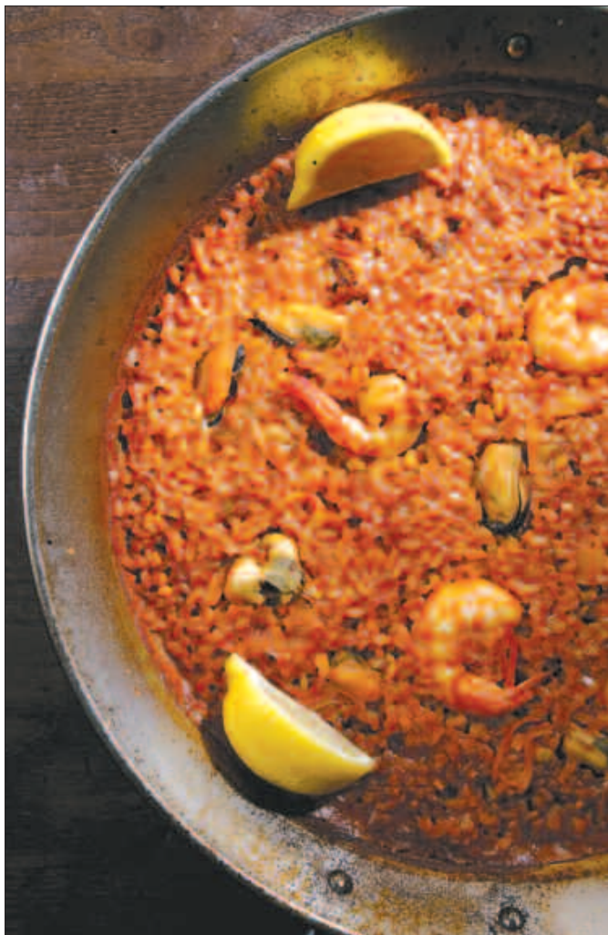
La paella valenciana viene con camarón, calamares y mejillones. Rinde para dos personas.